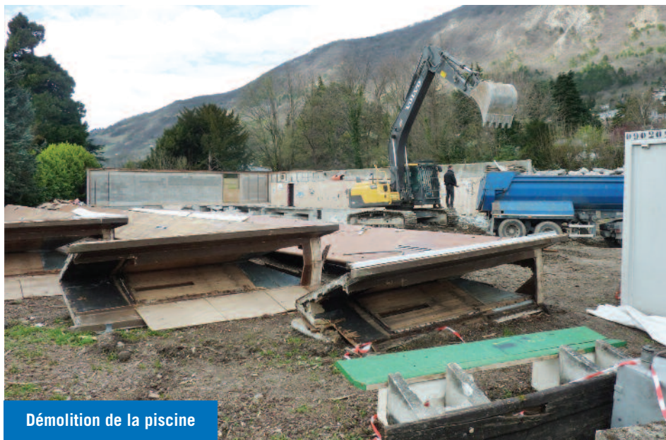
Démolition de la piscine