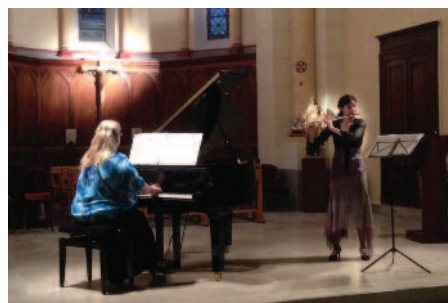
Concert à l'église