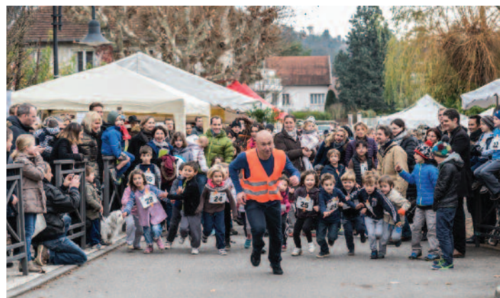
Course de Noël