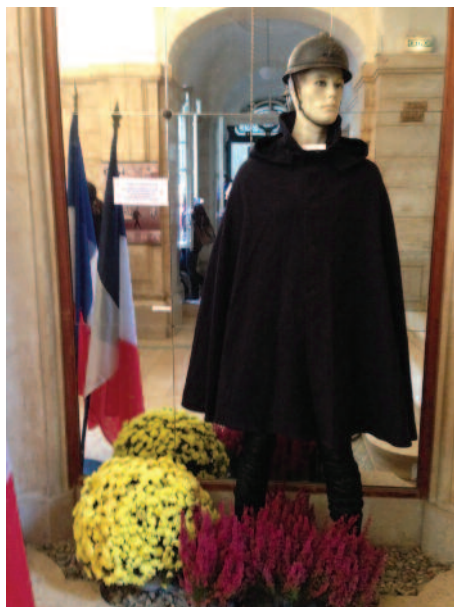
Poilus – 11 novembre

Le groupe de travail CAST a en charge la Culture, l'Animation, la Sécurité et la Tranquillité Publique. Beaucoup de son énergie est consacrée à animer la commune, en complément de tout ce que peuvent faire les associations. Ses maîtres mots : convivialité, qualité et rigueur budgétaire. Ci-dessous un aperçu du résultat en images.