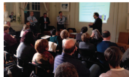
Réunion publique sur la sécurité