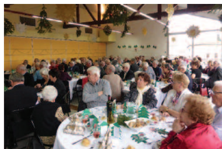
Repas des anciens