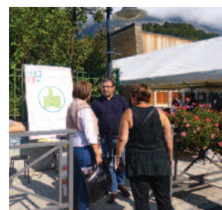
Tous en pouce, brocante