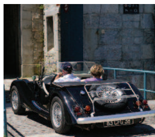
Route des forts