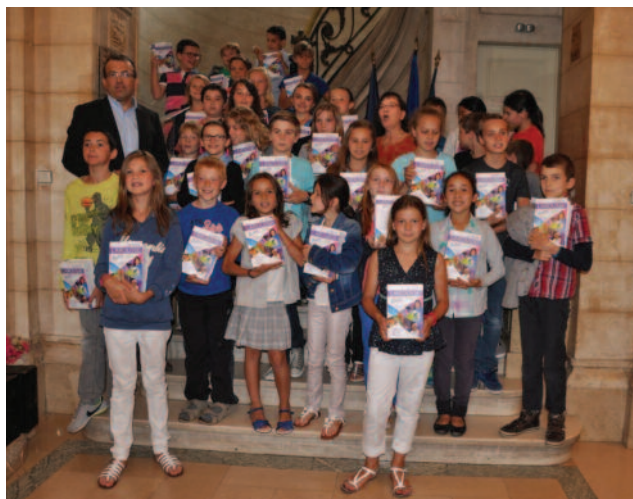
Remise des Dictionnaires aux futurs élèves de 6 e