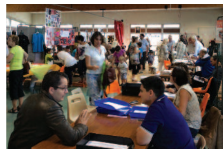
Le Forum des associations